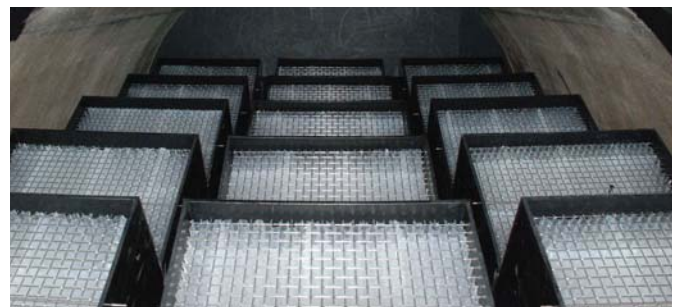
↑ tot Hydrocompact omgebouwde afscheider - levert schoon effluent water! ↓