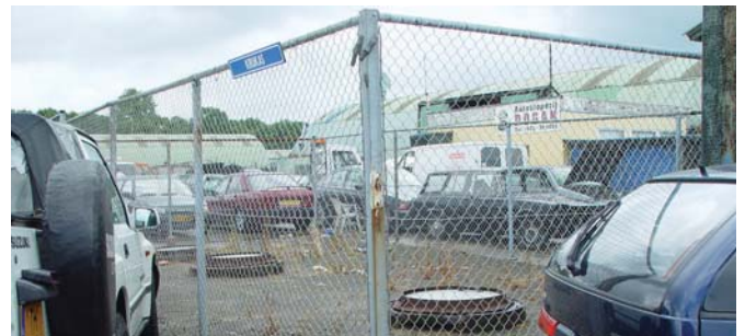
↑ de afscheiders liggen tussen de bedrijven, deels onder terrein in gebruik

© AQA HydraSep BV - februari 2012 - Wijzigingen voorbehouden. Informatie uit dit document mag niet verveelvoudigd en/of openbaar gemaakt worden zonder voorafgaande toestemming van AQA HydraSep, noch mag deze worden gebruikt voor enig ander doel dan waarvoor zij is opgesteld.