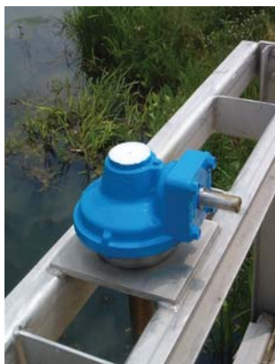
levering met veel varianten bediening en aandrijving