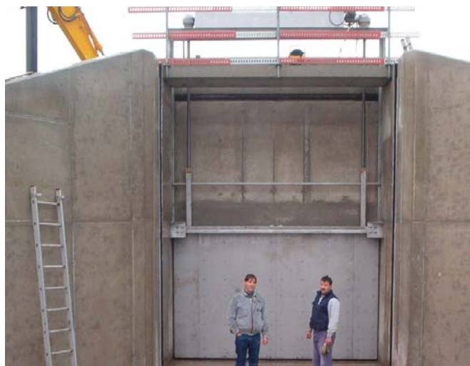
specialisatie in grote schuifafsluiters

Montagewerkzaamheden worden door eigen montagedienst uitgevoerd.