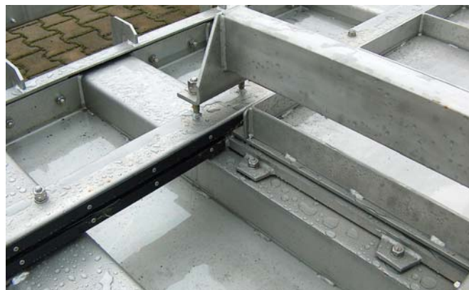
hoogwaardige afwerking in alle details